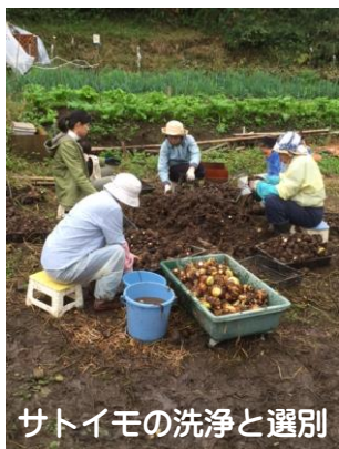
サトイモの洗浄と選別