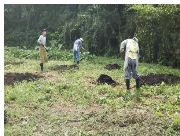
皆でコンポストを散布