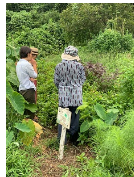
でんでん虫による藍染めシロメダカ(捕獲)