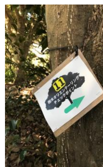
⑥外れていた番号札