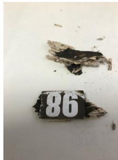
① 番号のついた破片