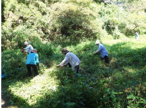
ヤブの中の懸命の草刈り

現場は広町最大のハンゲショウ群生地。繁殖力の強いカナムグラが周りの植生を圧倒するように群生するため、開花しているカナムグラが結実して種を落とさないようにするため、毎年、この時期にカナムグラ草刈りを行なっています。今回は「広町からの風」、「ポスター」で草刈り参加を呼び掛けて2名の助っ人参加を得ました。