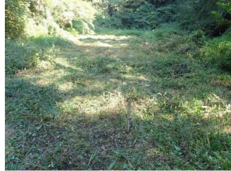
草刈り後のスッキリした群生地