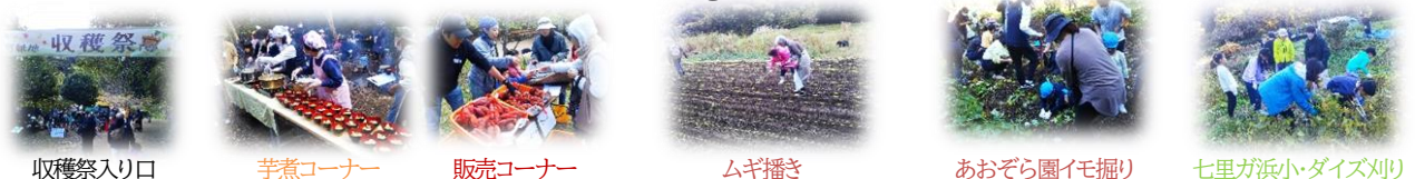
収穫祭入り口 芋煮コーナー 販売コーナー ムギ播き あおぞら園イモ掘り 七里が浜小・ダイズ刈り